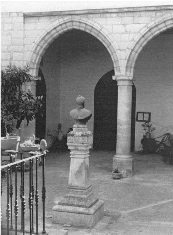
Santa Capilla de San Andrés, patio central y monumento al fundador

El testero se cierra con un retablo barroco de comienzos del XVIII. Lo preside un camarín con una preciosa talla de la Inmaculada bellamente policromada. Los laterales de la capilla se encuentran decorados con amplios lienzos pintados al óleo alusivos a la Virgen.