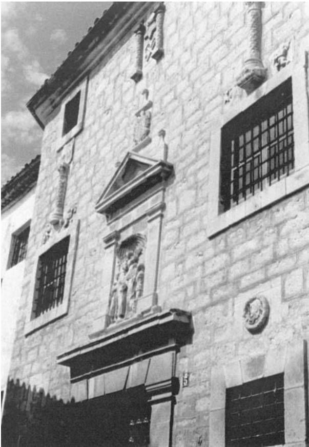
Santa Capilla de San Andrés, fachada principal

de conocer en causas y asuntos delegados por Su Santidad.