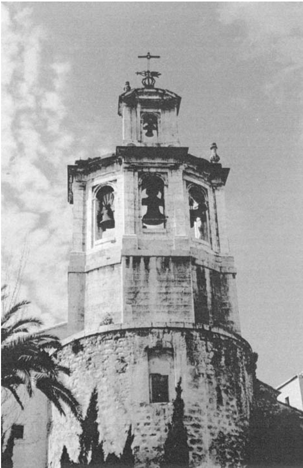
Santa Capilla de San Andrés Torre Campanario

oficios, varios, censos, numerosos patronatos de distintos personajes, cofradías, agregados, varios.