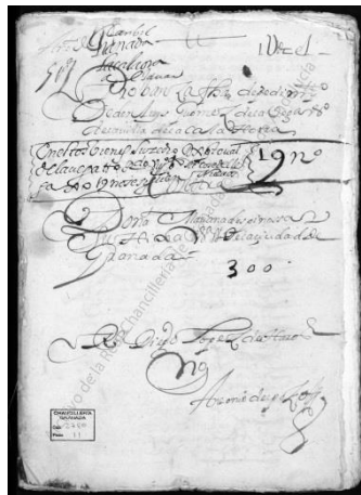
Portada del documento de estudio

Con esta comunicación, vamos a intentar hacer una pequeña aproximación al Camino Real que unía la capital de Jaén con tierras de la provincia de Granada, concretamente con Montejícar y Guadahortuna.