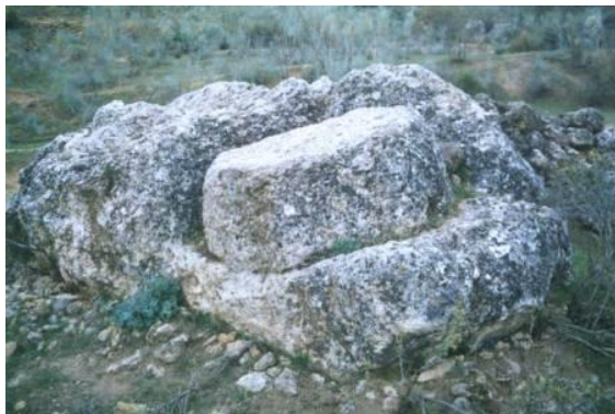
Piedra de molino cercana al molino del barranco

Linares a Cartagena, pasando por la Guardia y Guadix se situaría en las inmediaciones de Arbuniel, concretamente al lado de donde estuvo situado el molino de papel.