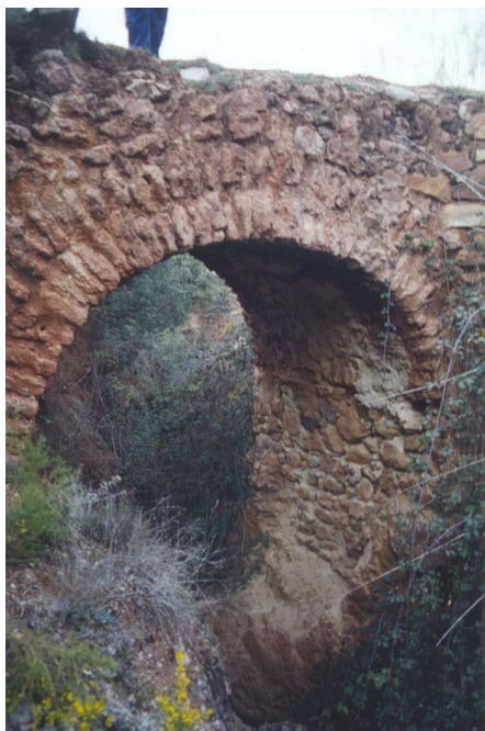
Puente del “barranquillo del muerto”