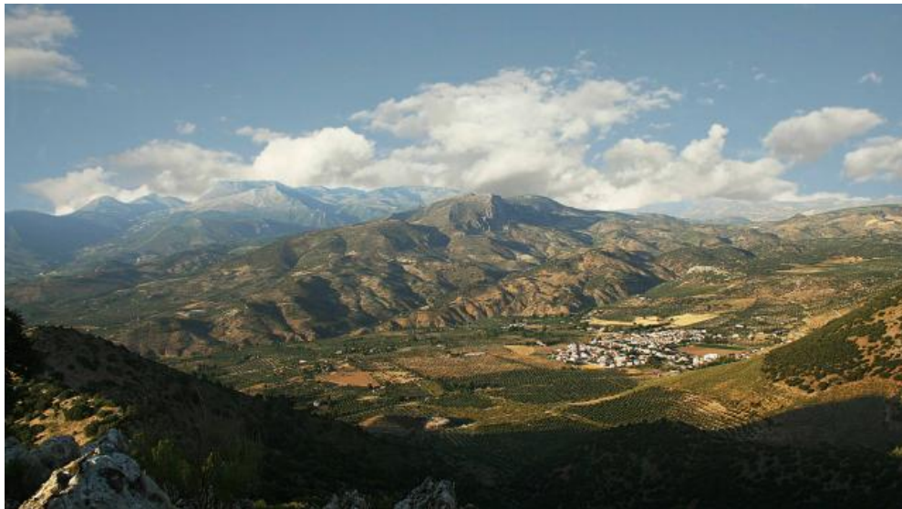
Vista de Arbuniel con Mágina al fondo

Queríamos presentar en este I Congreso Virtual sobre Historia de la Caminería, un paseo por las tierras de Arbuniel, pequeña población situada en la Comarca de Sierra Mágina. Para ello, hemos intentado plasmar aquí un recorrido visual de los restos, tanto arqueológicos como paisajísticos, que en la actualidad encontramos de lo que habría sido en su momento un pequeño tramo de vía romana entre Cástulo y Cartago Nova a su paso por el término municipal de Arbuniel, desde que la vía hace entrada en las tierras del municipio en el “Arroyo del Salado”, hasta su salida por el puente situado en el “Barranquillo del Muerto”.