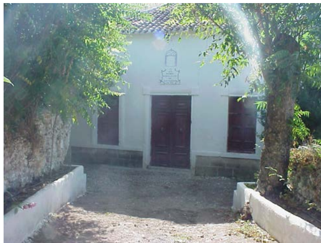
Central eléctrica de San Cayetano

Tampoco debemos dejar de olvidar el aprovechamiento de la fuerza de esta omnipresente agua que en tiempos no muy remotos movía molinos y creaba electricidad, tanta que autoabastecía a la población y exportaba a poblaciones cercanas. Aquí en “los Castaños” nos podremos acercar a ver la muestra de esta importante labor que el agua desarrollaba en Arbuniel en la central de San Cayetano. Esta central era propiedad de Hidroeléctrica San Cayetano, empresa creada en el año 1921, la cual explotó este salto desde su fundación hasta 1958 año en el cual cierran la instalación. El salto de esta central, llamado del Sacromonte Alto tenía una potencia de 50 kVA, un salto de 12,8 metros y un caudal 500 l/s. 10 En la actualidad ha sido rehabilitada por su actual propietario y en este singular espacio se puede contemplar la generación de electricidad, junto con la presencia de un molino harinero.