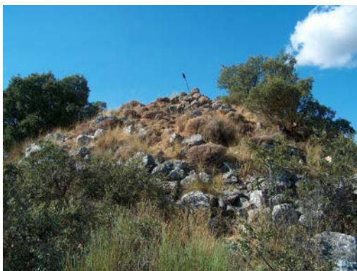
Atalaya de Torre Gallarín

metros de diámetro. En la actualidad está derruida, pero aún puede observarse la base de la misma. Está emplazada en un lugar estratégico desde el que se divisa amplia panorámica y equidistante de los castillos de Huelma y Montejícar, por lo que evidentemente fue un lugar de comunicación óptica entre ambos. Sin duda, es la antigua Torre Gallarín, que da nombre a esta zona de la Sierra de Alta Coloma, relacionada con la leyenda de un tesoro muy extendida en estos lugares, recogida y publicada por Manuel Amezcua Martínez 12