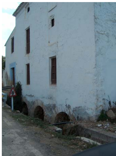
Molino de papel en la actualidad