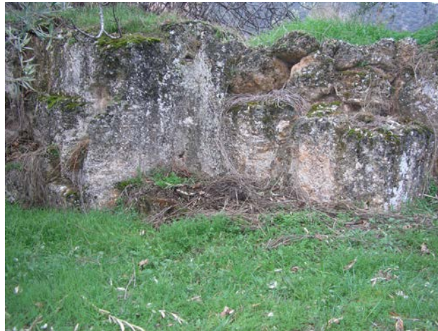
Detalle de una Cantera en Arbuniel

Desde este punto buscamos el camino que en dirección oeste va hacia “la ventilla” no sin antes hacer un pequeño desvío dirección este siguiendo la senda del torcal para en apenas 100 metros encontrar, junto a un pequeño cortijo situado en el margen izquierdo de la senda, una importante cantera de piedra, nueva muestra de la importancia que estas tierras tuvieron en tiempos pasados.