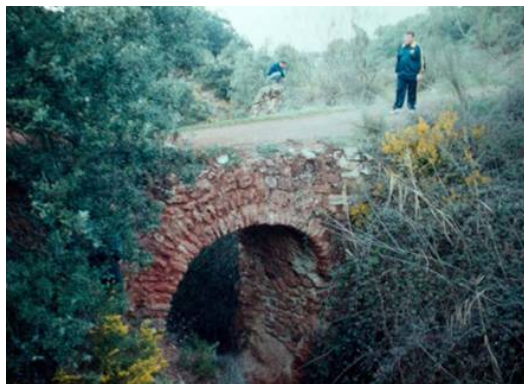
Puente sobre el "Barranquillo del Muerto"

Y aquí en este viejo y escondido puente, vigilados por la Torre de la Atalaya o de Gallarín acaba nuestro primer paseo narrado por las tierras de Arbuniel.