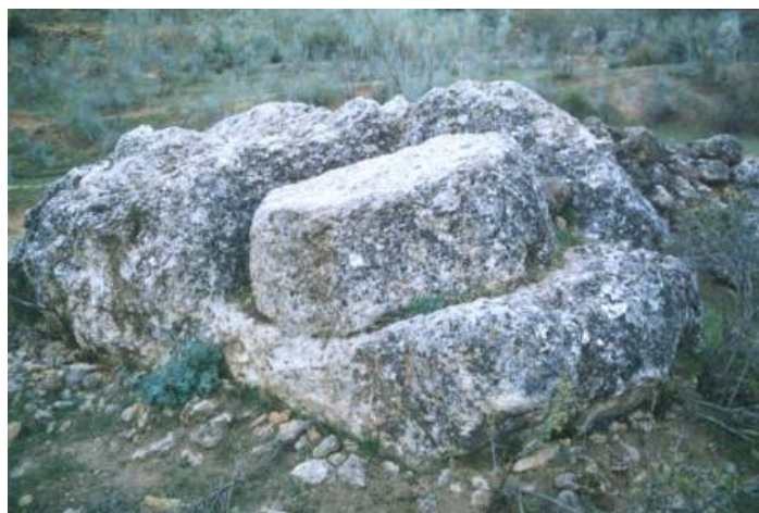
Piedra de molino en cantera

Éste es un lugar espectacular, pues las aguas del río Arbuniel caen desde una altura de alrededor de cuatro metros al barranco de los Batanes creando una escena visual y sonora singular. Justo aquí quedan los restos de lo que fue un pequeño acueducto que transportaba el agua al otro lado del barranco, formando un abrevadero para el ganado y dando riego y fertilidad a la vega del lado norte del río. Apenas a 50 metros de este lugar encontraremos el cortijo de los barrancos, en la actualidad casi abandonado pero que es un fiel reflejo de las típicas construcciones de Sierra Mágina. Justo detrás del cortijo se localiza uno de los molinos más antiguos de Arbuniel. El mismo, carece de pozo, que es sustituido por dos acequias con fuerte desnivel excavadas en la roca, que movían dos piedras. Junto a él existía una cantera de piedra de molino 5 , con una piedra labrada y sin extraer.