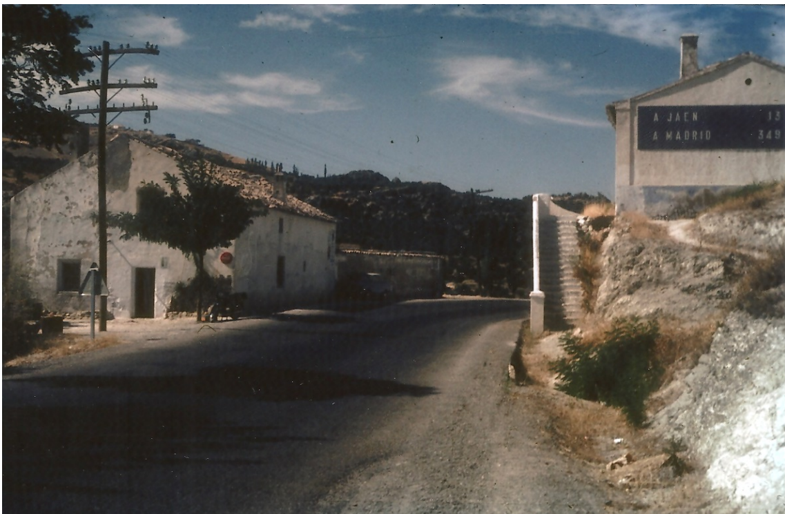
Venta de los Bailaores y Casilla de Peones Camineros. Carretera N-323 (La Guardia. Jaén)

Archivos consultados: Archivo Histórico Provincial de Jaén y Archivo de la Diputación Provincial de Jaén.