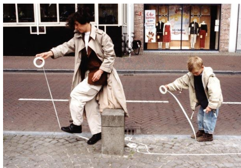
Esther Ferrer: Se hace camino al andar .

Esther Ferrer 6 es una artista que forma parte del grupo español de vanguardia ZAJ. Considerada posdadá, (pues el absurdo es un componente habitual de sus creaciones), también se implica en cuestiones de género, dedicando parte de su obra a la representación del cuerpo femenino como signo de identidad, invitando al espectador a que reflexione. Una de sus performances más conocidas se titula Se hace camino al andar , basado en la poesía de Antonio Machado. La performance se puede realizar en cualquier ciudad del mundo y en cada lugar la artista toma un punto de partida y va andando sobre rollos de cinta adhesiva. Va así trazando un camino que culminará donde ella decida. La línea indica de dónde vienen pero no dónde acabará. La creación es un ejemplo de la percepción que tiene la artista del espacio y del paso del tiempo pero también significa que ella es dueña de su propio destino y que la calle/el camino es hecha por ella misma.