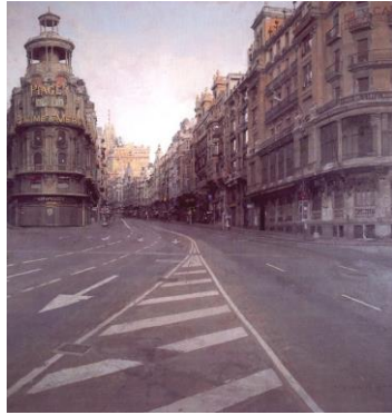
Antonio López: La Gran Vía .

surrealista 4 y así la reflejó, carente de presencia humana, atemporal, metafísica al fin, de modo similar a las pinturas de Giorgio de Chirico. 5