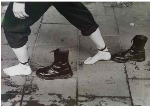
Mona Hatoum: Road Works .

En la otra performance, dos personas con la boca tapada con cinta adhesiva, vestidas con monos negros y descalzas, se echan al suelo de forma intermitente, dibujando la que permanece de pie una marca blanca, como de forense, alrededor del cuerpo de la persona tumbada. Acto seguido, la que se encuentra en el suelo sustituye al forense imaginario delineando, esta vez, la silueta de la que antes se encontraba de pie, y dejando en el suelo el rastro de los cuerpos caídos.