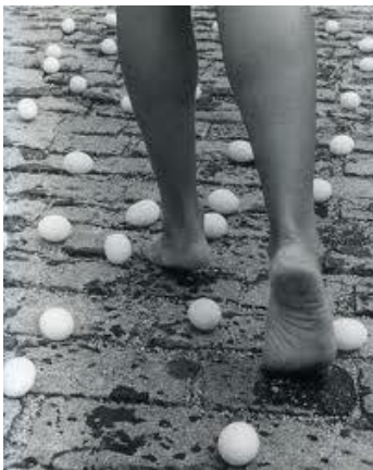
Anna M a Maiolino: Entrevidas .