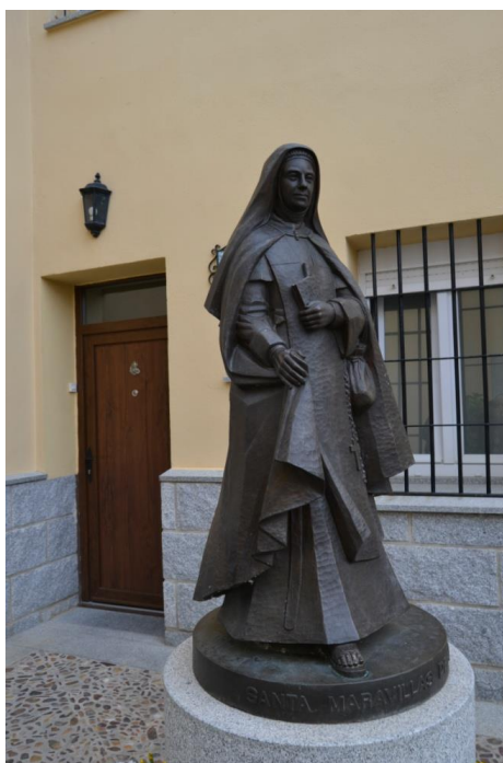
Imagen de Santa Maravillas de Jesús en la entrada del Carmelo de San Lorenzo de El Escorial.

A las entradas de estos Carmelos suele haber una imagen de Santa Maravillas con la iconografía que en base a ella se está realizando, con su libro y su bolsa de dinero para los pobres.