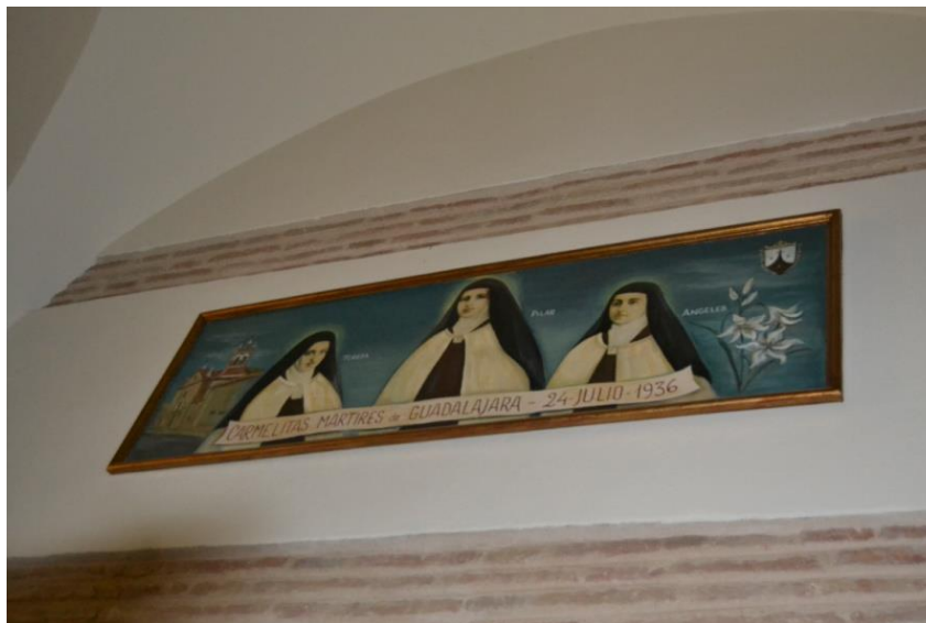
Santas mártires de Guadalajara, estampa en la nave del evangelio del convento de carmelitas descalzas de Ronda.