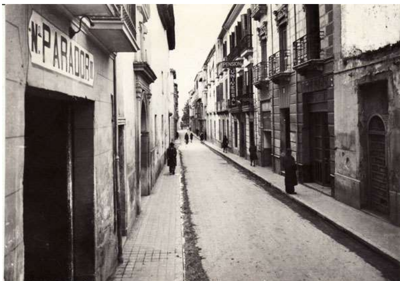
Imagen antigua de la calle Recogidas, entonces llamada Verónica. Se puede observar su estrechez comparada con la actual.

Más tarde, el beaterio pasó por varias vicisitudes, fue ocupado por los franceses; luego casa de vecinos; de nuevo beaterio en 1813 y después colegio de niñas regido por monjas Terciarias Carmelitas. En 1949 las beatas, integradas en la Congregación de Carmelitas Misioneras, abandonaron su primitiva residencia. El final fue su derribo en 1958 para el ensanche, alineación y apertura de la calle Recogidas.