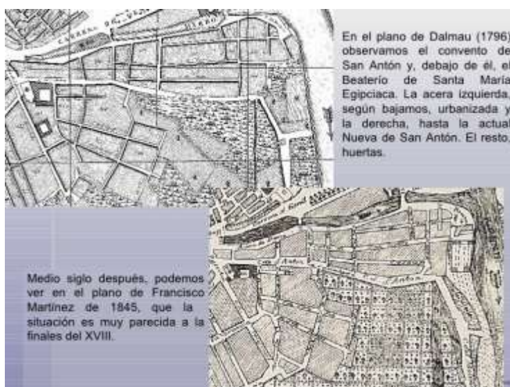
Plano de Dalmau(1796) y Plano de Francisco Martínez(1845)