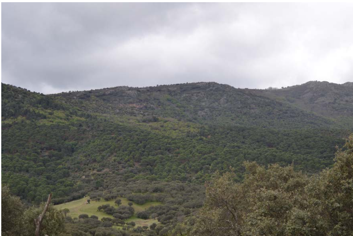
Foto 1. El Raso de la Iruela y el Puerto del Muradal

Nacional IV hasta el desdoblamiento de la vía en los años 80. Aún hoy, su papel como zona de servicios a la entrada o salida del paso de Despeñaperros recuerda los motivos históricos de su creación. Otras ventas cercanas no son tan conocidas, como ocurre con la del Melocotón o la del Chocolate, todas ellas relacionadas con el nuevo sistema viario desarrollado a lo largo del siglo XIX. Tras su desaparición física, resulta difícil ubicar actualmente cual era su emplazamiento, pero su recuerdo ha quedado plasmado en la cartografía y en la toponimia de la zona. 6