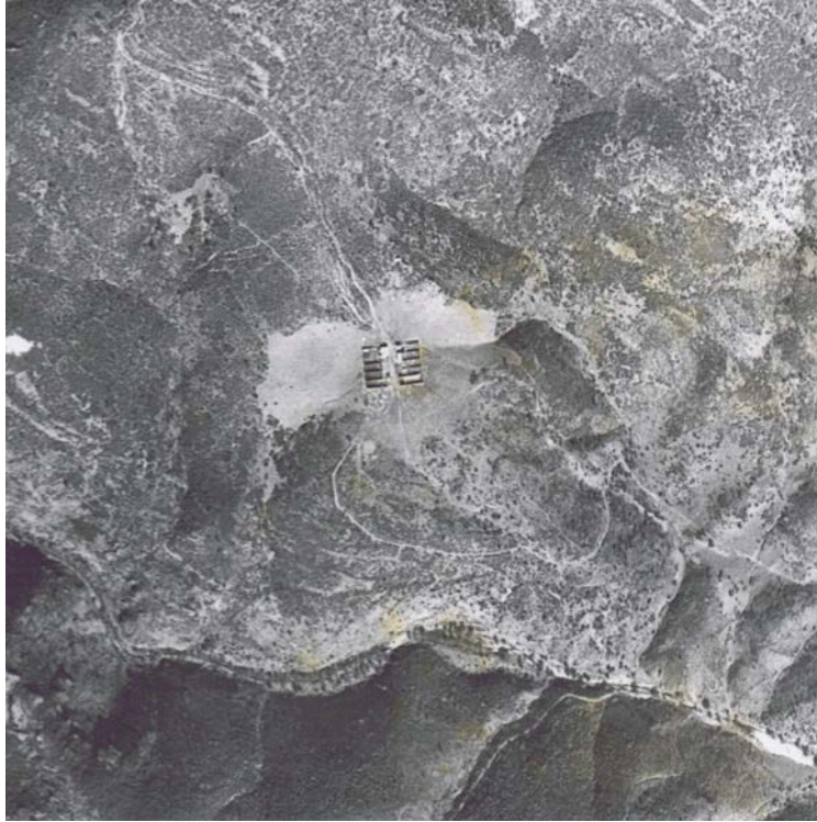
Foto 4. La Aldea de Magaña al norte del río. Fotografía aérea, año 1956.