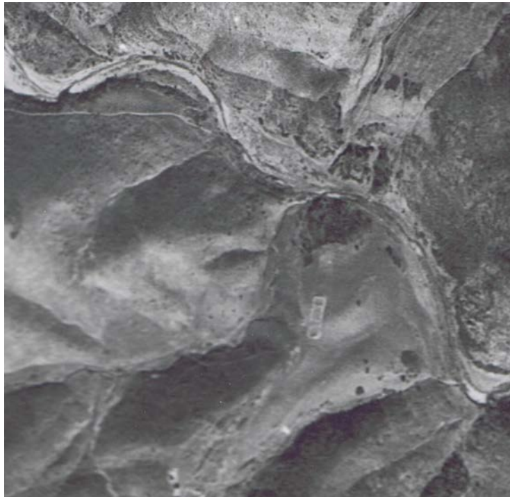
Foto 5. La Venta de La Iruela, a orillas del Magaña y al pie del Puerto del Muradal. Fotografía aérea año 1956.