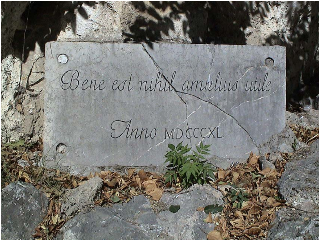
Lapida del Túnel de Santa Lucia

Dos placas conmemorativas nos informan de la autoría y utilidad de la obra, la primera situada en el entrada sur del túnel, encastrada en la roca por encima de la boca del túnel, presenta una dimensiones de 170 x 80 centímetros y en ella podemos leer en cuatro líneas de escritura, "ISABEL II / PARA UTILIDAD PUBLICA Y / COMODIDAD DE LOS VIAJEROS / AÑO DE 1840.