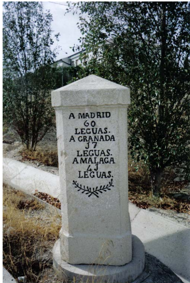
Leguario de Jaén

Se encuentra situado al borde de una rotonda a la salida de Jaén hacia Granada, a la margen izquierda, próximo al cementerio municipal. Al igual que el anterior esta realizado en piedra. Tiene una altura de 190 centímetros, su planta es octogonal presentando cuatro caras iguales y opuestas de 50 centímetros y cuatro chaflanes en las esquinas de 10 centímetros. Sobre una de las cuatro caras igual y en 9 líneas de escritura podemos leer: A MADRID / 60 / LEGUAS / A GRANADA / 17 / LEGUAS / A MALAGA / 41 / LEGUAS