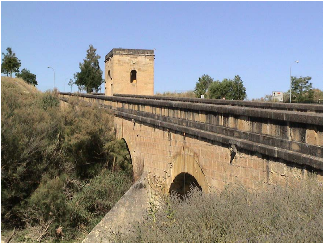
Vista general del Puente del Obispo

En la parte de mayor desnivel, aguas abajo, se levanta una sólida torre pegada al mismo de planta cuadrada, rematada al nivel de la rasante del puente con una capilla, con puerta abocinada de medio punto, a ambos lados de la puerta aparecen dos lápidas iguales con inscripciones góticas. Estas dos lápidas fueron colocadas en 1925 con motivo de las obras de reparación del puente y reproducen a la original desaparecida, que se encontraba sobre la puerta de la capilla.