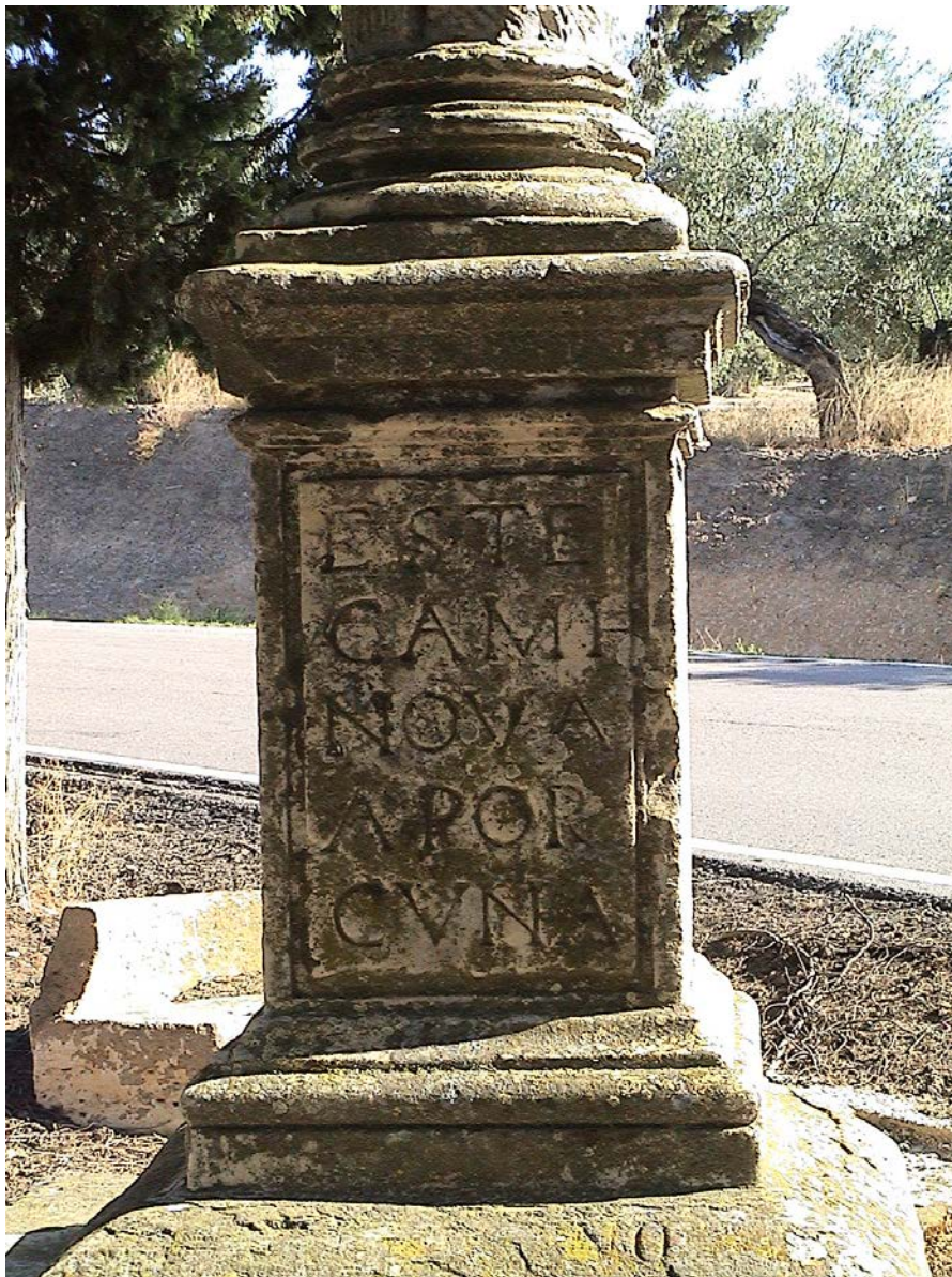
Pedestal Cruz de Mendoza

Esta cruz fue erigida por la Cofradía de los Ángeles y Misericordia en el año de 1595, según figura en una de las inscripciones del pedestal. Pero lo mas interesante de esta Cruz, y que confirma de algún modo nuestras sospechas de que las cruces de termino servían de indicación para los caminantes, es lo reflejado en dos de las inscripciones restantes, donde podemos leer: “ESTE / CAMI / NO VA / A LO / PERA” y en la cara opuesta “ESTE / CAMI / NO VA / A POR / CUNA”