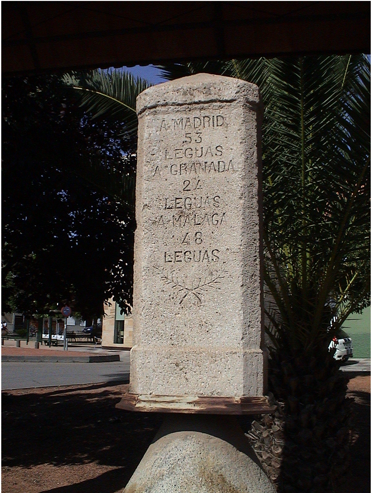
Leguario de Bailén