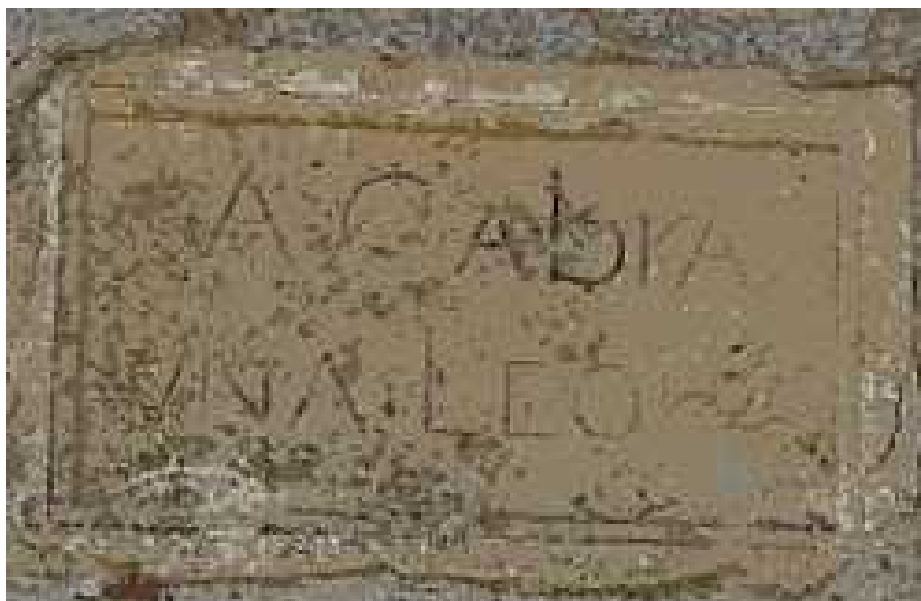
Lápida leguario del Nicho de la Legua

No vamos a recordar ahora la historia de cómo al final el lienzo recala en la Villa de Cabrilla, a la que renombraría, ni de la fama milagrosa de la pintura, que transformaría la pequeña localidad en un concurrido santuario a donde acudirían cofradías y hermandades desde los mas remotos lugares.