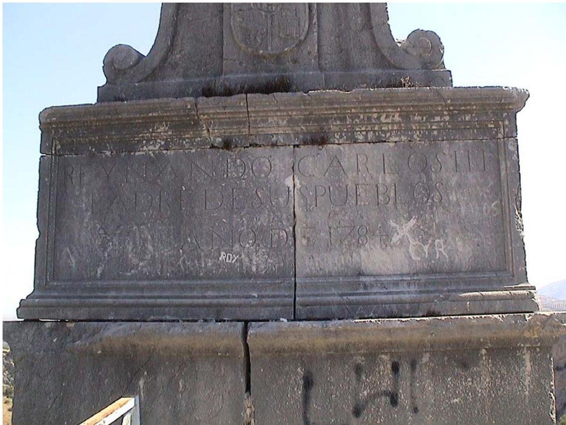
Parte central del Vitor de Carlos III

“y entre el término de dichos lugares (Cárcel y Carchelejo) y esta Villa al poniente, una venta que llamada de la Oya o de La Cerradura por donde pasaba antes el camino Real de Coches de Madrid para Granada y hace poco mas de veinte años que por una avenida quedó intransitable dicho camino para los coches, y aun por La Cerradura esta también molesto para todo pasaje”