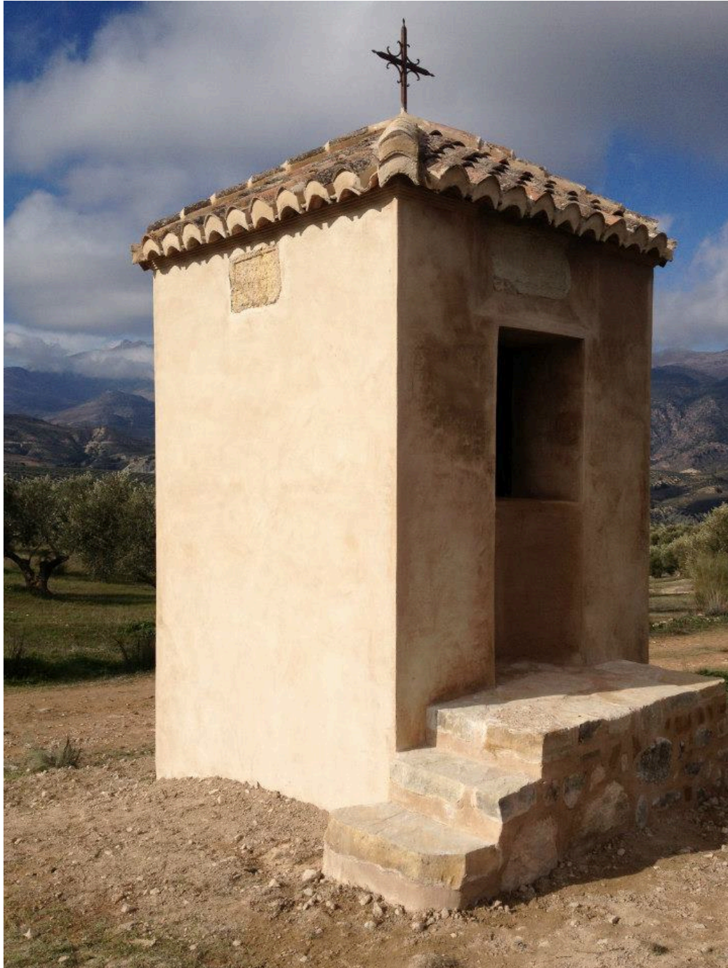
Humilladero del Nicho de la Legua

El sencillo monumento está fechado en 1637 y después de muchos años de un penoso abandono ha sido felizmente restaurado recientemente.