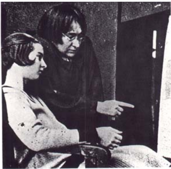
María Blanchard atendiendo una lección de pintura

Nace María en Santander en el seno de una familia burguesa, preocupada por la cultura como lo demuestra el hecho de que su abuelo fundó el periódico “La Abeja Montañesa” y su padre la revista literaria, o según otros autores periódico, “El Atlántico”. Este ambiente intelectual en el que se desarrolló quizás fuera el causante de su inclinación por la pintura, o bien, que no estuviera mal vista esa inclinación sobre todo en el ambiente de la época, ni qué decir tiene que el oficio de pintora no sería la primera inclinación de las burguesas de provincias.