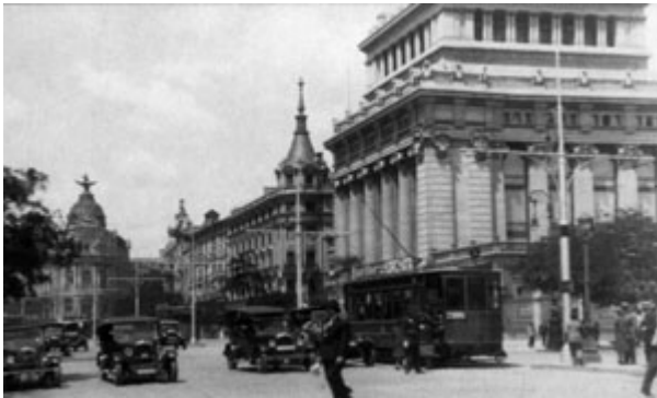
Madrid Calle Alcalá 1910

Esta exposición causará un gran revuelo en la capital, testimonio del cual deja constancia Ramón Gómez de la Serna. “... En el iterregno de la muestra de arte nuevo,