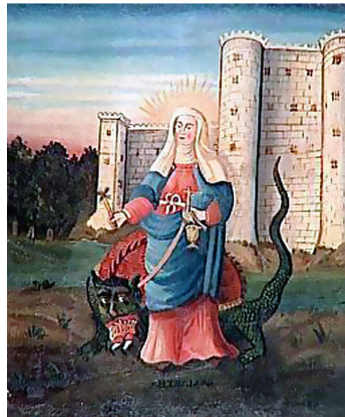
Fig. 4 Marta sometiendo a la Tarasca. Siglo XVIII. Museo de Artes y tradiciones populares. Tarascón.

La hagiografía “legendaria” provenzal recoge el hecho de que Marta, tras Cristo ascender a los cielos, se embarcó junto Lázaro y María; llegando a las costas de Marsella para predicar el cristianismo en Tarascon, dentro de la Provenza. Allí domará a la Tarasca, un dragón fluvial que dominó rociándolo con agua bendita y rodeándole el cuello con su cinturón.