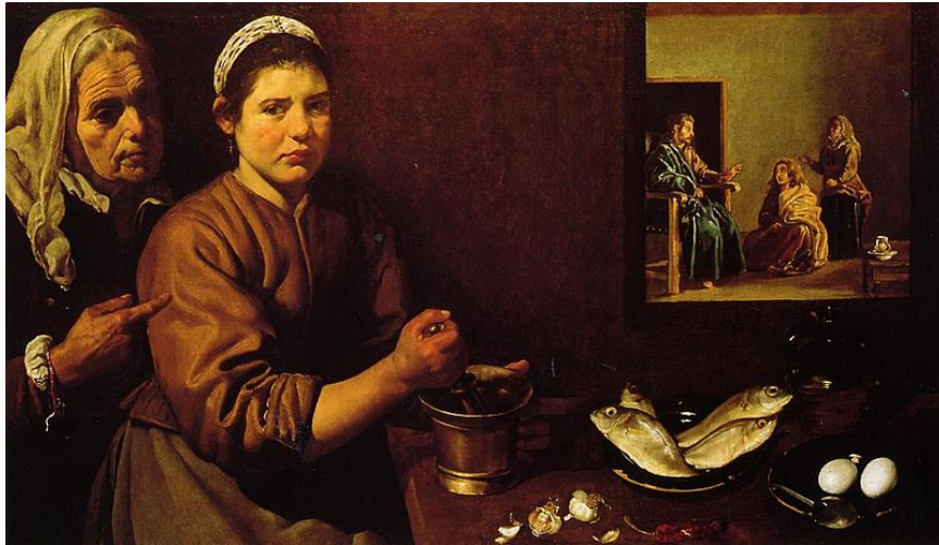
Fig. 2 Cristo en casa de Marta y María , Diego Velázquez