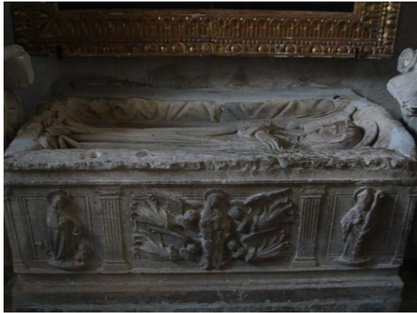
Fig. 7 Sepulchro de Santa Marta en la iglesia homónima de Tarascón. Provenza (Francia).

A mediados del siglo XII, en 1187, se descubre un sepulcro en Tarascón que se afirma como el de la Santa. La pequeña localidad se convierte así en un lugar de peregrinación. La tradición seguirá recogiendo los múltiples milagros que se obran por su intercesión, como el del rey francés Eldovio; que tras peregrinar a Tarascón y sanar de sus fuertes dolores de espalda, se convierte al cristianismo.