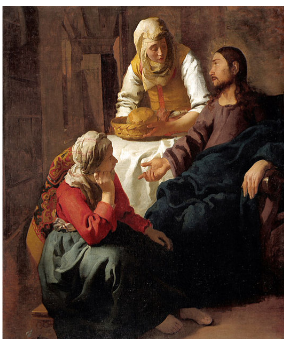
Fig. 1 Cristo con Marta y María, Johannes Veermer

En este pasaje de Lucas se recoge uno de los motivos más característicos y singulares que conformarán la iconografía de Santa Marta: la confrontación entre la vida contemplativa y la vida activa (simbolizadas en las figuras de María y Marta, respectivamente); el debate entre si se debe atender las necesidades diarias del trabajo o la atención a la propia vida espiritual, para alcanzar la meta de la salvación eterna del ama que sigue a Cristo. La representación pictórica de este