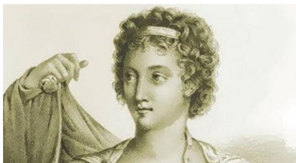
Figura 1. Gnódice

“Agnódice nace a mediados del siglo IV a.C. en la ciudad de Atenas. El nombre de Agnódice significa en griego “Casta ante la Ley”. SU padre era ciudadano ateniense y tenía una buena condición económica. Las mujeres atenienses eran controladas por sus padres, hermanos, esposos e incluso hijos. Eran ciudadanas de tercera categoría. Fue una niña curiosa y muy inteligente que poseía un carácter fuerte y tenía un insaciable interés por las cuestiones del mundo y de la ciencia.”