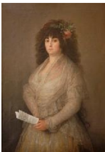
Fig.1.La Tirana. 1794.

Ambos retratos siguen las pautas de la retratística neoclásica: contornos firmes perfectamente delimitados, luz uniforme, el personaje posando sobre un fondo neutro... Goya sin embargo no se limita a repetir las características estilísticas de la retratística del momento y destaca los rasgos más resaltables de su labor como actriz y sus buenas cualidades para la escena: con su rostro altivo y mirada soberbia de mujer de carácter intenta mostrar al espectador los personajes que encarnaba.