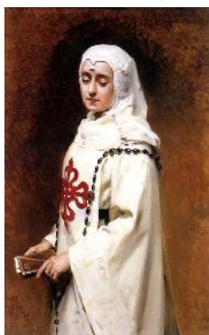
Fig.2. María Guerrero como Doña Inés. 1891.

Con su expresión María Guerrero muestra todas las cualidades de Doña Inés: ingenua, inocente, sencilla. Es el rostro de la mujer buena y pura que transforma al pecador por amor.